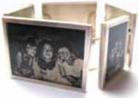
Foto: Armband med personlege bilete